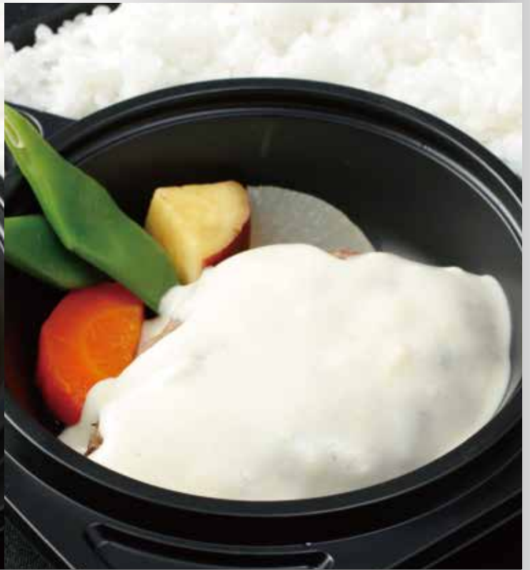
煮込みハンバーグ（デミグラスソース or 柚子胡椒クリーム）