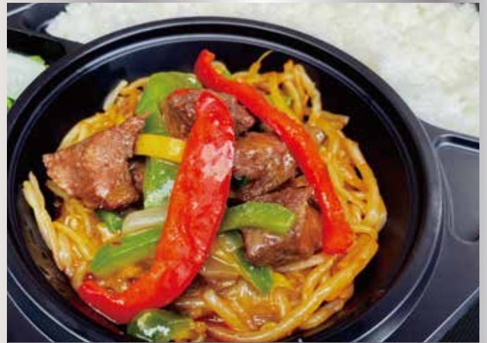
サイコロステーキ